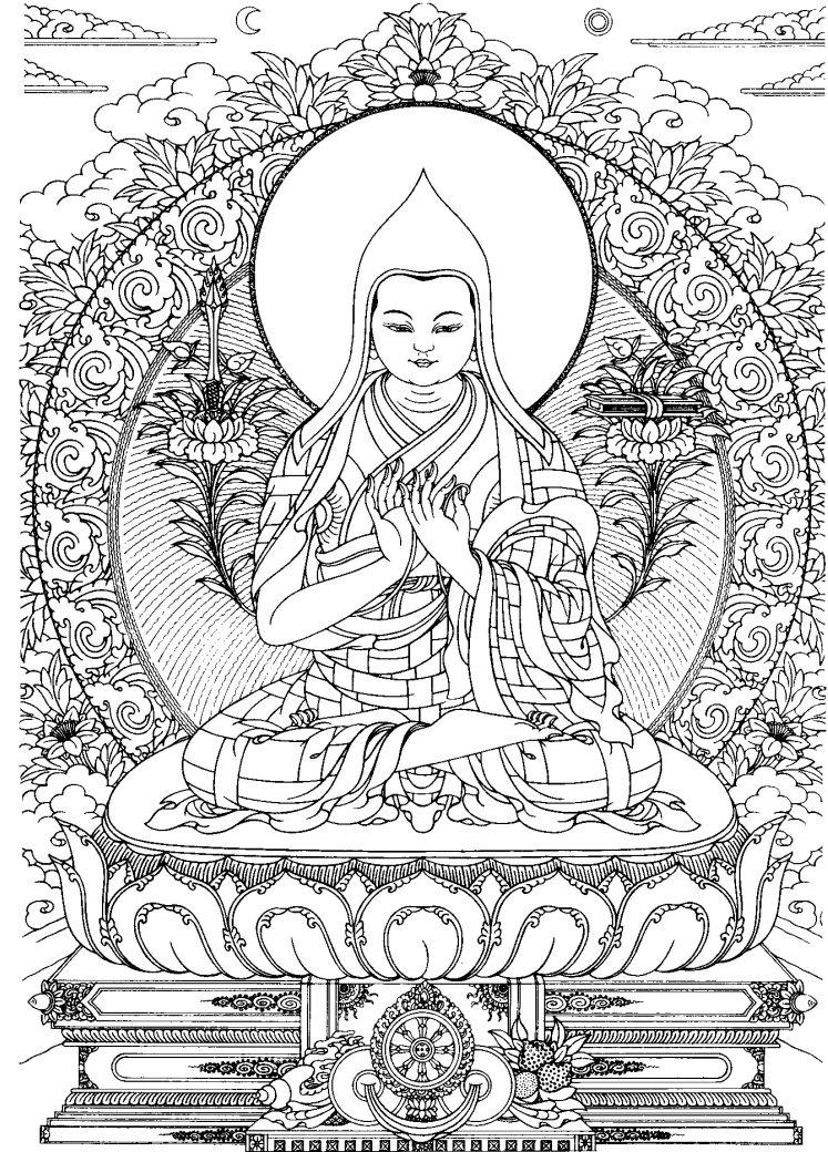
Lama Tông Khách Ba [Lama Tsong Khapa]